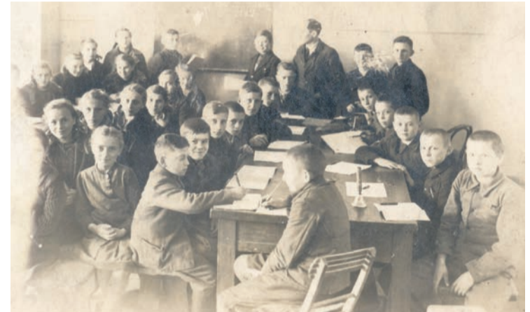
Pierwsi uczniowie po wojnie, Dąbkowizna 1945 r. (arch. M. Dąbkowskiej-Dudy)

sale gimnastyczne, place zabaw, boiska, a warunki edukacyjne znacząco się poprawiły, choć niekiedy potrzebują dalszego doskonalenia. Od 2019 r. w Stanisławowie Pierwszym działa Liceum Ogólnokształcące im. Stanisława Lema.