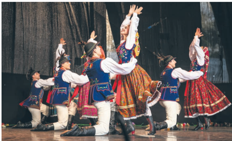
Fot. Bartłomiej Lichocki