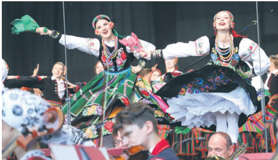
Fot. Anna Michejda