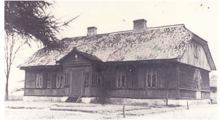
Drewniany budynek szkoły w Nieporęcie tzw. Dworek, lata 30. XX w. (arch. Nieporęckiego Stowarzyszenia Historycznego)

W czasie II wojny światowej w Nieporęcie i Zegrzu odbywało się tajne nauczanie. W wyniku ciężkich walk w 1944 r. praktycznie wszystkie szkoły w gminie zostały zrównane z ziemią. Szczęśliwie ocalał powstały w końcu lat 30. budynek w Nieporęcie, jednak wymagał kapitalnego remontu i częściowej odbudowy. Społeczność lokalna i nauczyciele